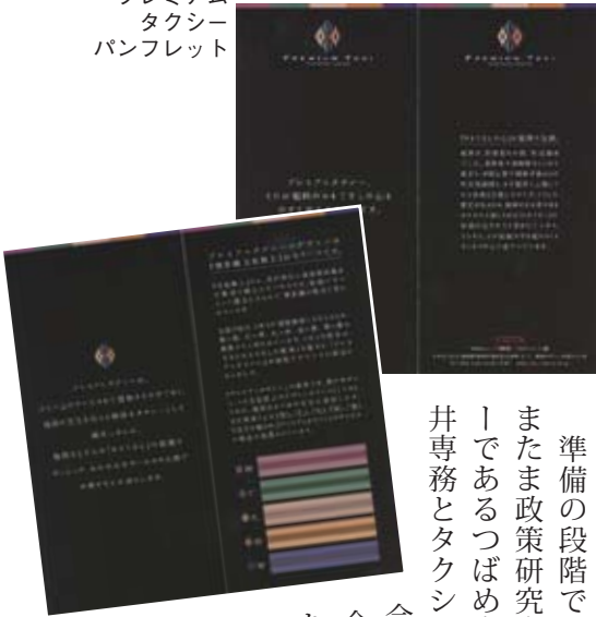
プレミアムタクシーパンフレット

手元に短冊形の小さなパンフレットがある。真っ黒な地に上部にほんの数ミリの幅で博多織の五色の色が印刷され、英文字で小さくPREMIUM TAXIの文字。そして中央部に「プレミアムタクシー、それは福岡のおもてなしの心をのせて走るタクシーです。」と白抜きで文字で控えめに書いてある。パンフレットの見開きを開いてみても、タクシーの写真は何処にもない。あるのはプレミアムタクシーのデザインのモチーフになった「博多織五色献