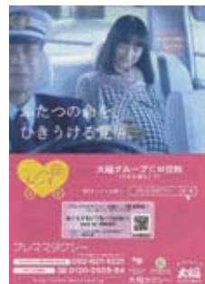
プレママタクシー

実は名古屋タクシー政策研究会は、プレミアムタクシー見学の前に、もう一箇所福岡市内のタクシー事業者を訪れている。それは本コラムで